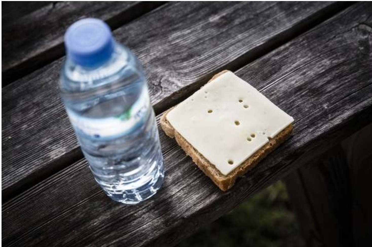
Hver pilot sørger for at hente drikkevarer til bagsmækken.

Lige da hun mistede synet, overbeviste hun hurtigt sig selv om, at hun sagtens kunne klare sig selv. Hun var også lige ved at tabe både næse og mund, da hun i en alder af 30 år blev tilbudt hjemmehjælp. Dét nægtede hun. Hun nægtede også at tage imod den mikroovn, som skulle gøre det let for hende at opvarme den mad, hun nu ville få leveret.