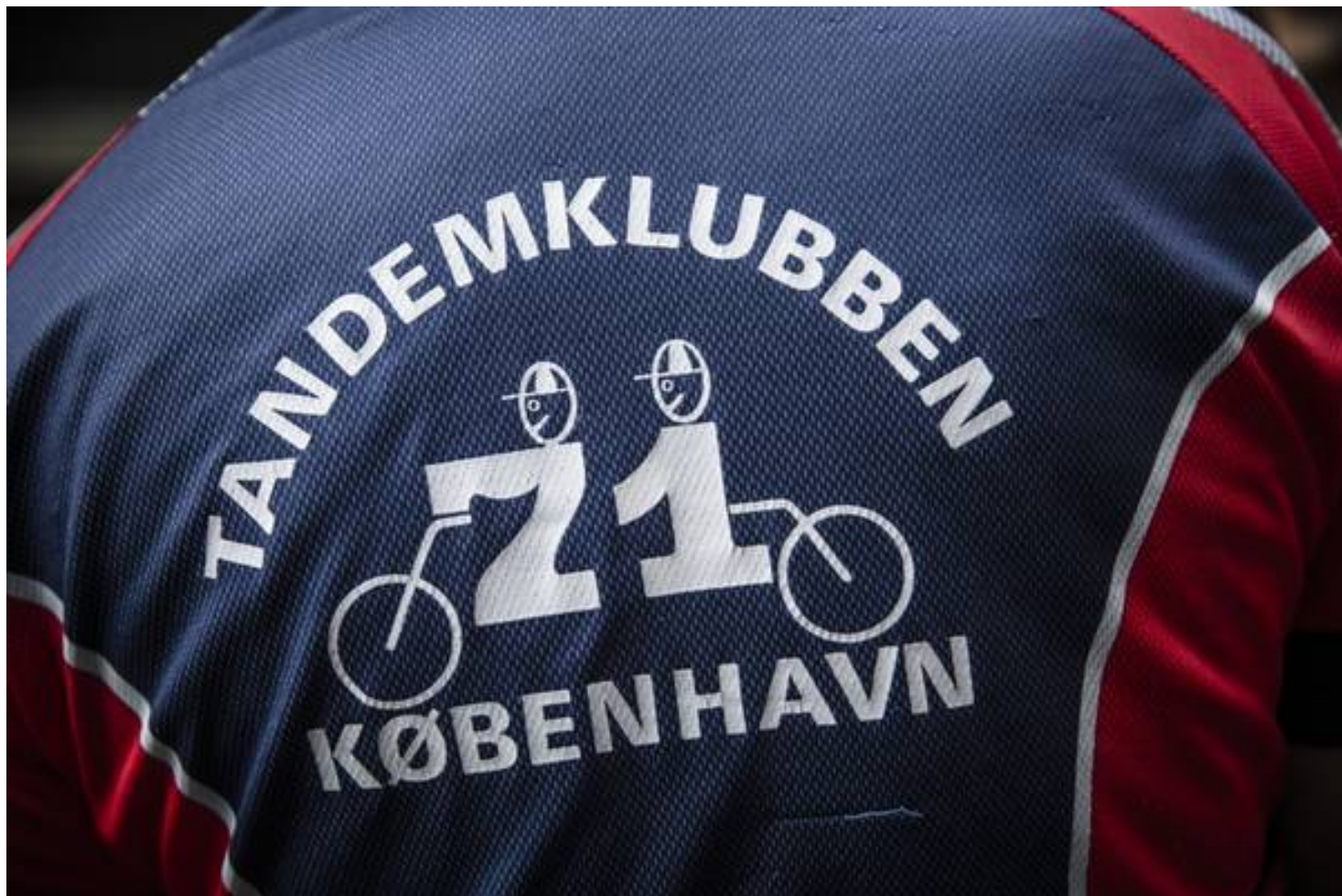
Det er kun en enkelt klub i Aalborg, der er ældre end den københavnske tandemklub.

Efter den sidste slurk er drukket, er det igen om at spænde cykelhjelm, for nu peger forgæfnerne hjemad mod klubhuset på Østerbro. Mørket sænker sig og temperaturen med. Anette tager en ekstra trøje uden på den karrygule kortærmer, der fremhæver hendes sommerbrune kulør. Når hun prøver tøj, kan hun nogenlunde mærke sig frem til, om det sidder ordentligt. Men en vurdering af om det klæder hende, er hun nødt til at overlade til andre.