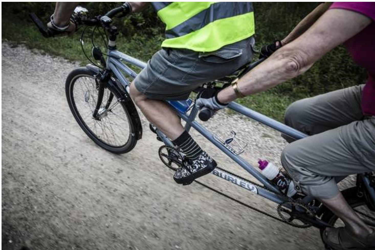
Når der er to til at træde, kræver det færre kræfter at holde en høj fart.

Den går ikke længere. Og efter nogle laserbehandlinger og operationer, der i glimt så ud til at give hende synet tilbage, gik alvoren op for hende i februar 1991.